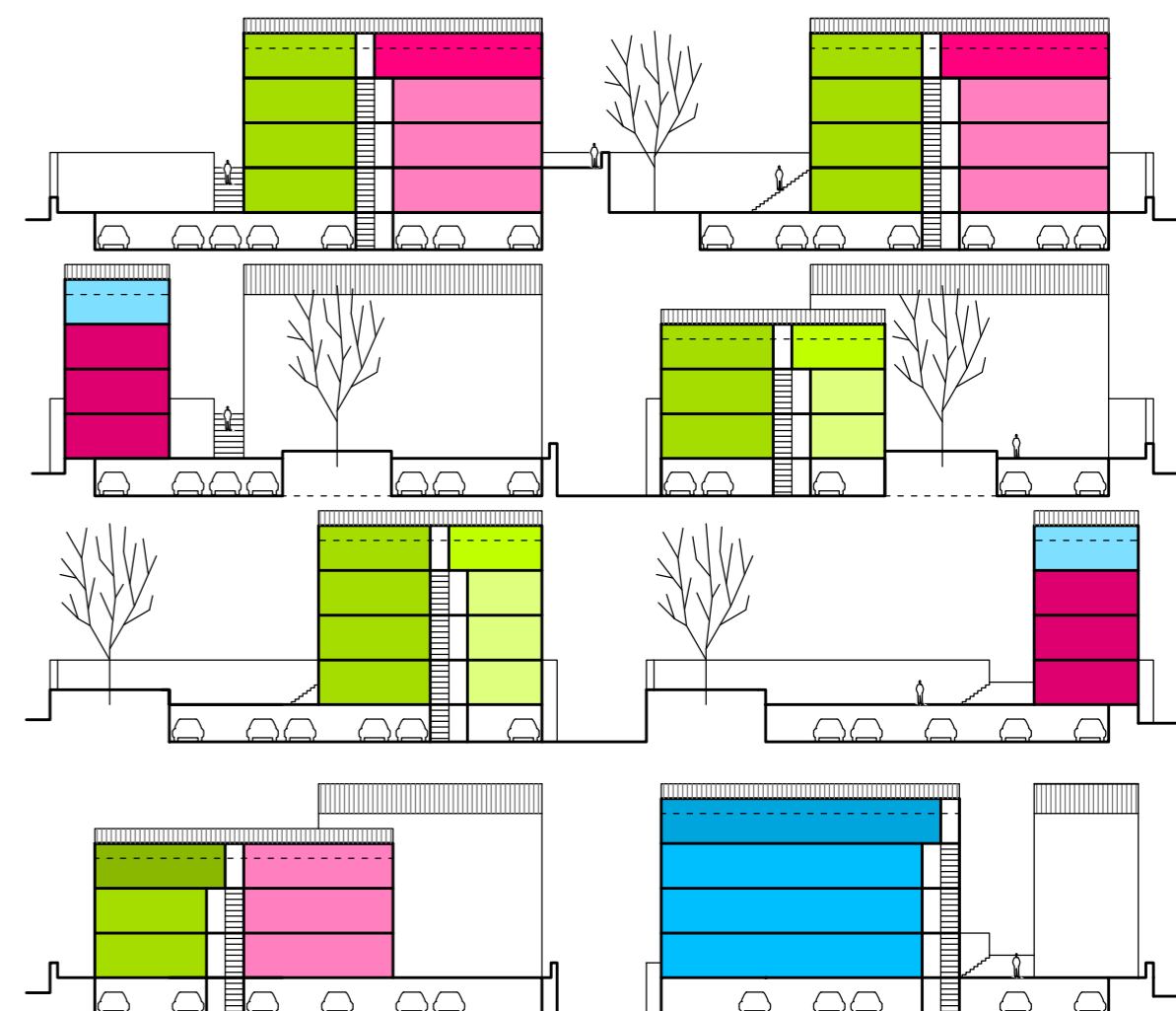
SHEMA ORGANIZACIJE STANOVA U DVOROVIMA

- pojavnost arhitekture / ad-hoc estetika . Predlaže se jednostavno i ekonomično oblikovanje oplošja zgrada. Baza je betonska, katkad visine dva kata, a nadgrađe - gruba žbuka ili betonske blokete, izmjenično postavljene oko svakog dvora. Sve u prirodnim tonovima materijala, osim zida ovojnice koji je „izvana“ nešto tamnijeg karaktera, a „iznutra“ (prema naselju) u svjetlijem tonu. Ekonomija gradnje se ogleda i u izbjegavanju balkona/istaka, osim za unutrašnju stranu ovojnice/zida, kao suprotnosti vanjskoj, „glatkoj“ strani. Zaštita od sunca se generalno rješava škurama, za sva tri tipa. Identitetu susjedstva doprinose i dvorišta intenzivno premežena tiramolima, kao i tipizirana vanjska spremišta (iskazana kao pomoćne građevine) od prozirnog valovitog polikarbonata u boji i tonu po izboru projektanta, u maniri popularne ad-hoc estetike koju susrećemo, primjerice, u Kaštelima.