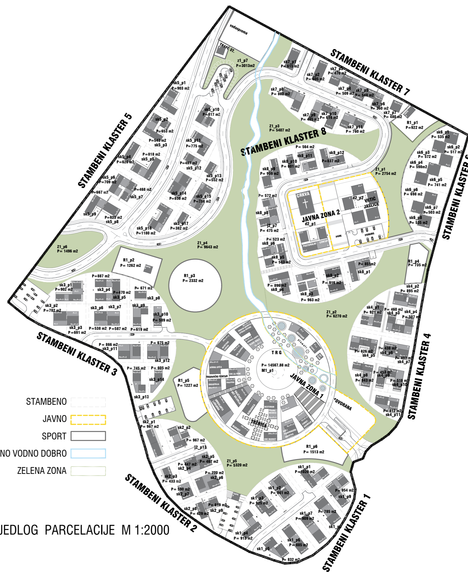
PRIJEDLOG PARCELACIJE M 1:2000