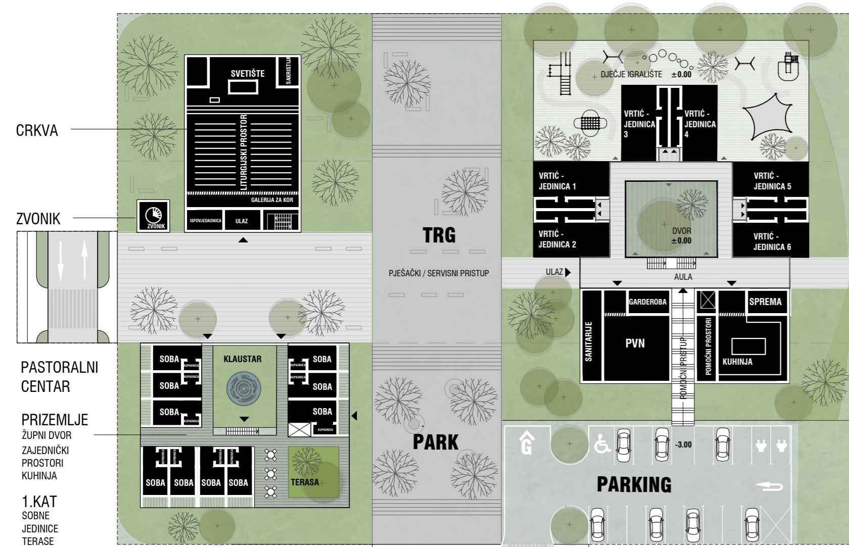
JAVNA ZONA 2: VRTIĆ, JASLICE, CRKVA I PASTORALNI CENTAR M 1:500