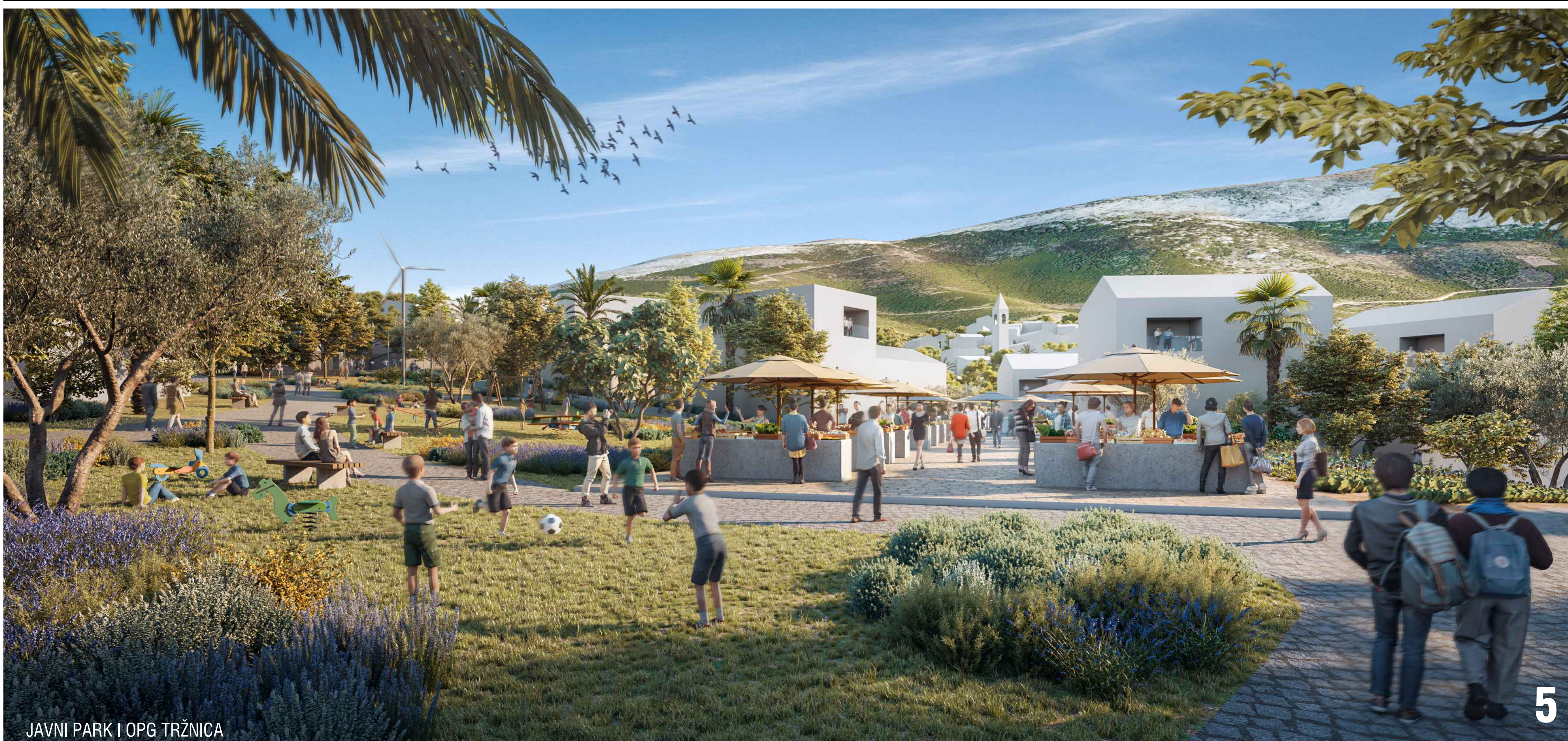
JAVNI PARK I OPG TRŽNICA